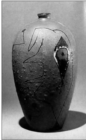
Resim 4: Miro, 1941-1945, h:36

Miro ise seramik sanatçısı olan arkadaşı Artigas'tan etkilenecek ve onun teşvik etmesi ile birçok seramik ve heykel üretmiştir (Resim 4).