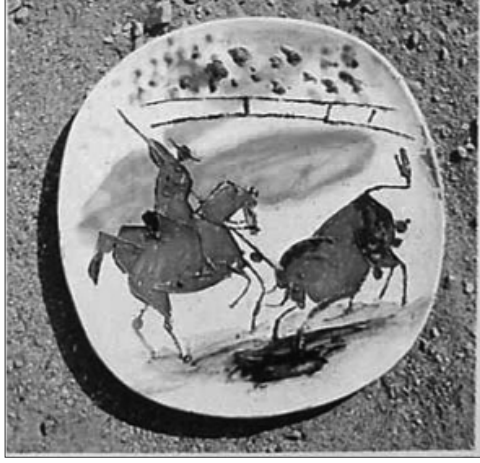
Resim 3: Picasso, "Matador", h:24

seramik üretimi, onun resim sanatındaki düşün tarzının genel yansıması biçimindedir (Resim 3). Ancak beklide onun asıl başarısı kendisini sürekli olarak yenilemiş olmasıdır. Bu yenilenme/yenilik ve koşulsuz üretim anlayışı söylemlerinde de vücut bulmaktadır.