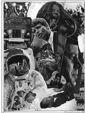
Resim 3. Robert Rauschenberg, Signs, 1970, Kağıt Üzerine Kolaj ve Serigraf.

Günümüzde, dünya, gittikçe küçülen, en sonunda da mega-köye dönüştürülen bir süreç olarak varlığını somutlandırmıştır. Temelinde bir bilgi ve enformasyon dinamiğini de barındıran modern oluşum, sayılabilir bir dünya yaratırken, sanatı da gösterinin ve satın alınabilir değerlerin kıstasları içinde değerlendirmeye başladı. Postmodernitenin "anything goes" (her şey olur) gerçekliği ile diyalektik bir sürece de kendisini dahil ederek; adeta çoktan seçmeli bir dünya-sanat tanımı, kavramı ve olgusu karşımıza çıkmaktadır. Batılı olmayan toplumların hemen hepsinde kısmi, göreceli bir modernleşme ve doğal olarak da postmodern algı durumu olduğunu da özellikle belirtmek gerekir. Zaten gerçek bir modernleşme deneyimi yaşamamış bir toplumda postmodern olandan, kimlik ve bakış açısından bahsetmek ironik de olacaktır (Akçaoğlu, 2004: 159). Robert Rauschenberg gibi sanatçılar evrensel olan, ve tüm dünyayı ilgilendiren değerleri, kültürel yapıları, tarihi olayları ele alarak bunları yeni söylemler katarak yorumlamaktadır. Burada geleneksel olan yenedünya düzeni içinde yeniden bir kültür katmanı yaratmaktadır denilebilir.