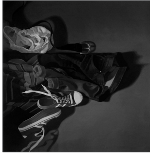
Resim 2. Michael Leonard, Sneakers Engluties, 1976, Tuval Üzeri Akrilik, 66 x 67.3 cm.

Bu açıdan bakıldığında sanatçı kimi zaman sadece ele aldığı konu gereği değil kullandığı materyal ve seçmiş olduğu media ile de geleneksel olarak konumlanabiliyor. Sanatçı için seçmiş olduğu teknik, içinde yaşıyor olduğu çağ ile örtüşmediği zaman, geçmişten günümüze sanatın salt varlığı içerisinde var olan gelenekleri taşımaktadır denilebilir. Sanatın gelenekle olan ilişkisi bağlamında, sanatçı kullandığı teknik ile de geleneksel olarak konumlanabilmektedir. Örneğin Michael Leonard eserlerinde geleneksel boya tekniği ile gerçekçilik kavramını sorgulamaktadır denilebilir.